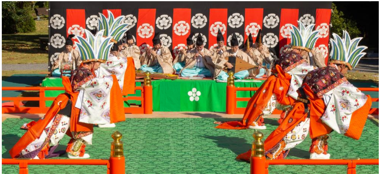
じよのいちじょう 序一帖

現存する舞楽の中で最長大曲。香りは、いつも同じではなく、はかなく漂う美しさが特徴で、音楽に表現すると、曲調、強弱や拍子、そして舞振りも、場面ごとの変化が美しい。